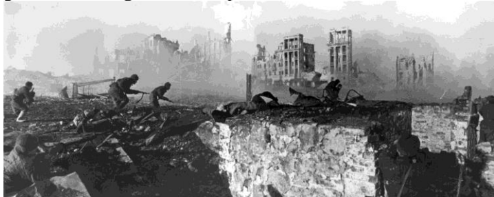
Un ataque del Ejército Rojo en un barrio de viviendas de Stalingrado, 1942.

Con el objetivo de garantizar el máximo secretismo durante la planificación de operaciones, el mando soviético recurrió a la codificación especial de los apellidos de los responsableS de la toma de decisiones y la dirección operativa. Así, el propio Stalin se convirtió en 'Vasíliev', mientras que el futuro 'mariscal de la Victoria', el entonces general Gueorgui Zhúkov pasó a ser 'Konstantínov'.