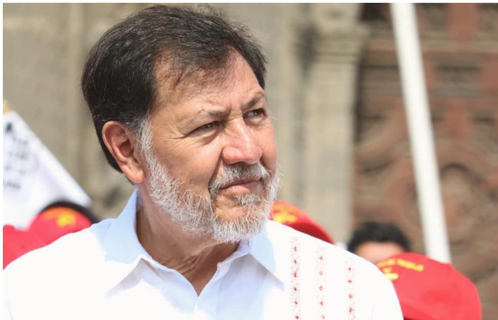
Gerardo Fernández Noroña.

Sociólogo de formación marxista por la Universidad Autónoma Metropolitana (UAM) y exvocero del PRD, el legislador por el Partido del Trabajo se dice listo para ganar la encuesta.