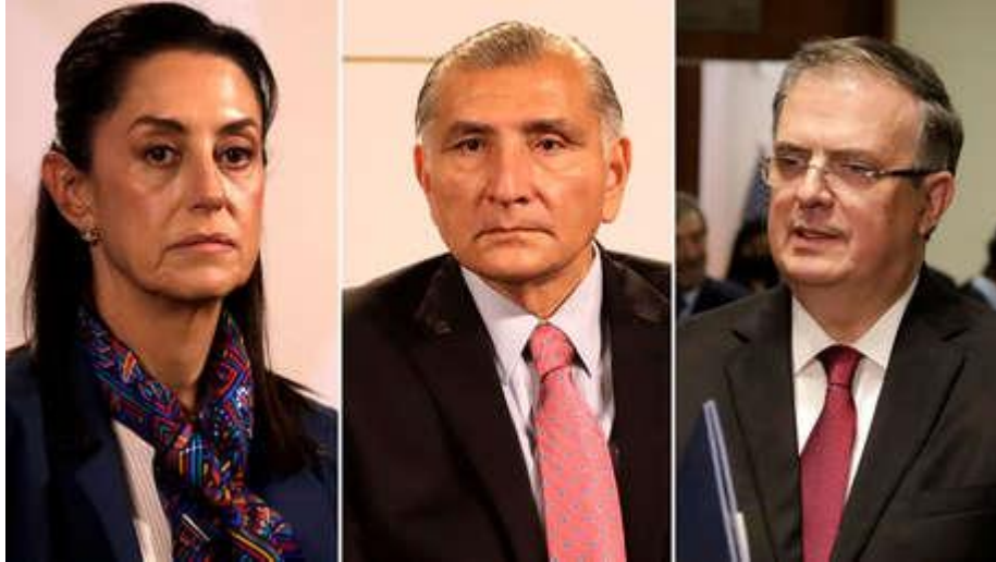
Claudia Sheinbaum, Adán Augusto López y Marcelo Ebrard.