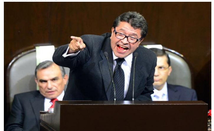
El legislador Ricardo Monreal en el Congreso, 1 de diciembre del 2012.

De acuerdo con la versión del legislador morenista, el distanciamiento con el mandatario comenzó a partir de mediados de 2021.