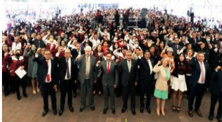
El 8 de febrero, mil 300 Maestros del