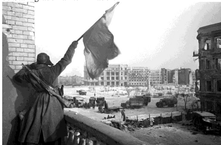
Un soldado del Ejército Rojo iza la bandera roja de la URSS entre las ruinas de Stalingrado, febrero de 1943.

Al final de esa jornada, el coronel general Konstantín Rokossovski , al mando del frente del Don, y un representante del Cuartel General Supremo, el mariscal de artillería Nikolái Vóronov, comunicaron a Stalin: "En cumplimiento de su orden, las tropas del frente del Don completaron a las 16:00 (hora local) del 2.02.43 la derrota y eliminación de la agrupación de Stalingrado del enemigo. A raíz de la destrucción completa de las tropas cercadas del enemigo , las acciones bélicas en la ciudad y en las afueras de Stalingrado han terminado".