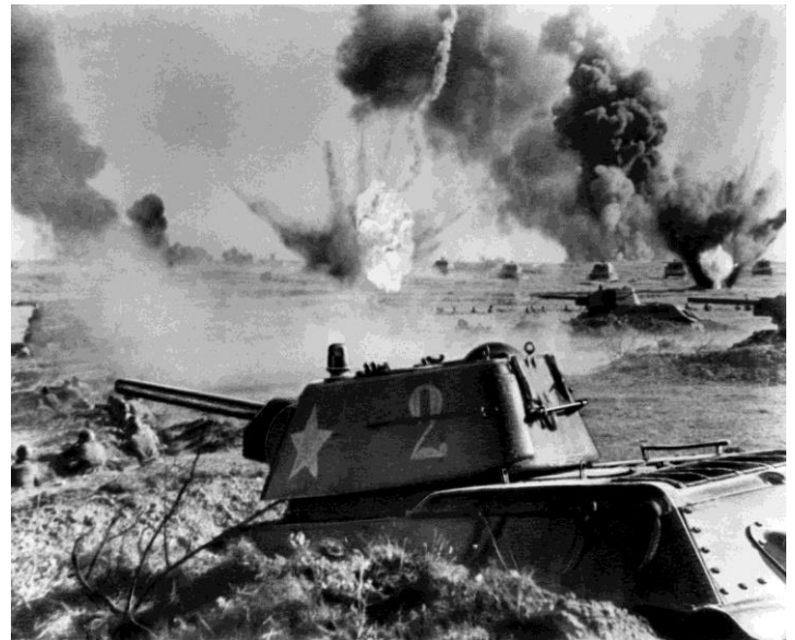
Los tanques soviéticos T-34 en el campo de batalla cerca de Stalingrado, 1942 o 1943.

El 15 de noviembre, 'Konstantínov' recibió un telegrama de Stalin que le concedía la autonomía en la toma de decisión sobre "la reubicación de Fiódorov e Ivanov" en el rango de dos días antes o después. 'Fiódorov' era el nombre en clave de Nikolái Vatunin, líder del Frente suroccidental, mientras que 'Ivanov' era el comandante Andréi Yeriómenko.