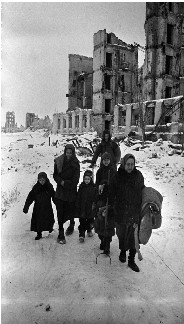
Un grupo de civiles vuelve a Stalingrado tras la derrota nazi, en febrero de 1943

Adolf Hitler no permitió que Paulus retirara sus tropas hacia el oeste y le ordenó resistir "a cualquier precio" en la ciudad, el 80 % de la cual estaba ocupada por los alemanes para finales de octubre. En diciembre, el grupo de ejércitos del Don de la Wehrmacht emprendió un último intento de desbloqueo del 6.º ejército, pero la operación fracasó, mientras que el mando soviético activó un plan para su destrucción.